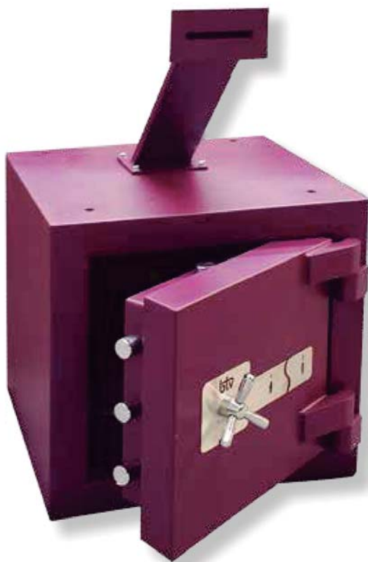
Gasolinera 300 2K