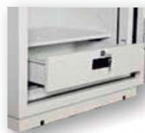
Cajón interior en mod. 120-E