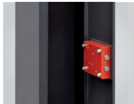
Cierre con 2 bulones de 18 mm de diámetro.