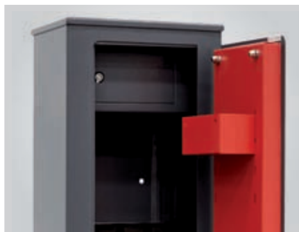
Cajón interior con llave (en mod. D-APF.4KTADV y D-APF.4KTCMF).