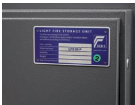
Resistente al fuego. Certificado según norma europea EN15659.