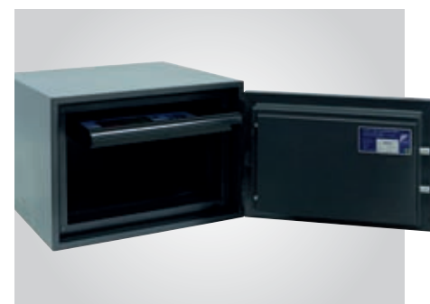
Incluye bandeja extraíble en la parte superior.