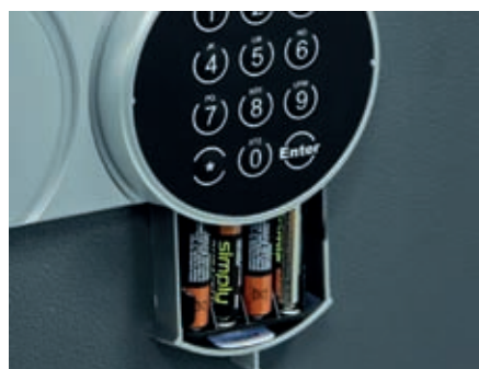
Portapilas alojado en el exterior bajo el teclado.